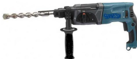
Wiertarka + wiertło \varnothing 8